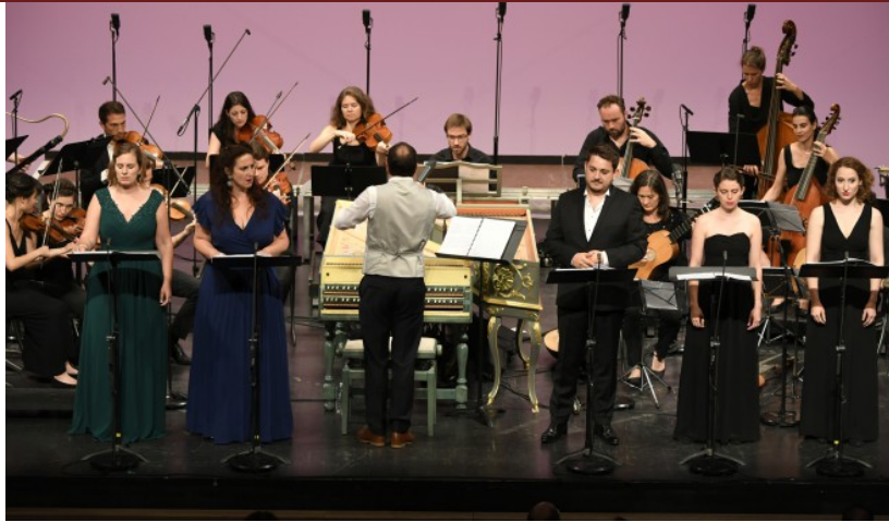
Issé en concert